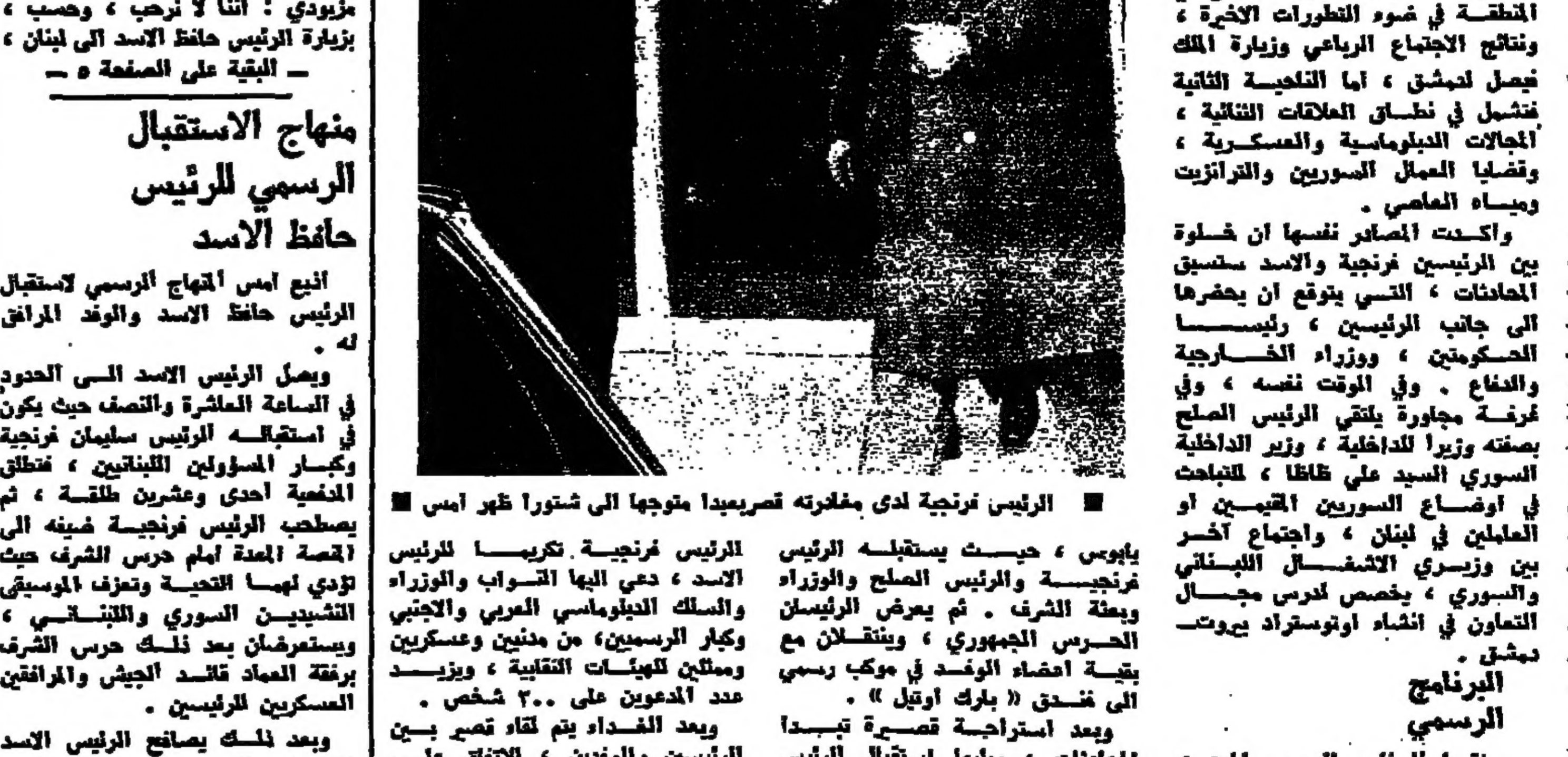
الرئيس ترحيباً لدى مغادرته قصر صيدا متوجهاً الى شتورا ظهر أمس